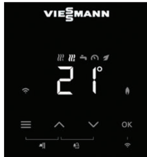
Οθόνη LCD με κουμπιά αφής