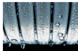
Εναλλάκτης θερμότητας Inox-Radial

στους ανοξείδωτους εναλλάκτες θερμότητας σε επιτοίχους λέβητες αερίου συμπύκνωσης έως τα 150 kW